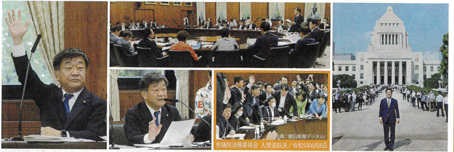
参議院法務委員会 入管法採決 / 令和5年6月8日

昨年秋の臨時国会から参議院予算委員会理事として令和4年度第二次補正予算、令和5年予算等の審議に携わり、災害対策特別委員会理事、国土交通委員会委員として、5か年加速化対策以降後も延長を図る国土強靱化基本法の改正や、適正な維持管理体制と高速道路ネットワーク整備を両立するための道路整備特別措置法の改正などの重要法案の成立に全力で取り組んでまいりました。 7回の質疑等に立つ機会を活かし、インフラ整備の加速や建設産業分野の担い手確保、賃上げ環境の整備等の必要性について訴えました。