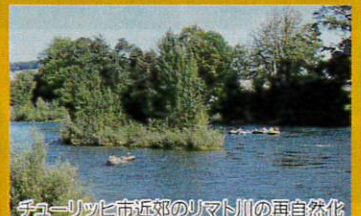
チューリッヒ市近郊のリマト川の再自然化