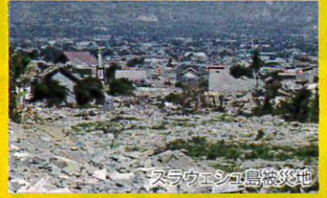
スラウェシ島被災地