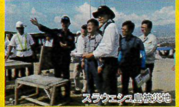
スラウェシ島被災地