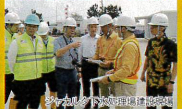
ジャカルタ下水処理場建設現場