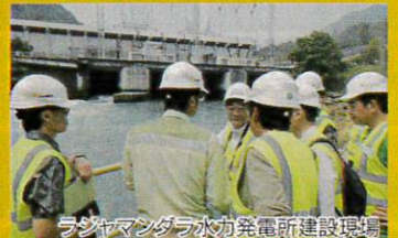
ラジャマンダラ水力発電所建設現場